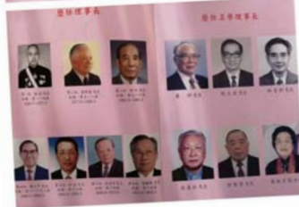
台北温州同乡会成立60年来，队伍不断壮大，是台湾地区最有影响力的社团之