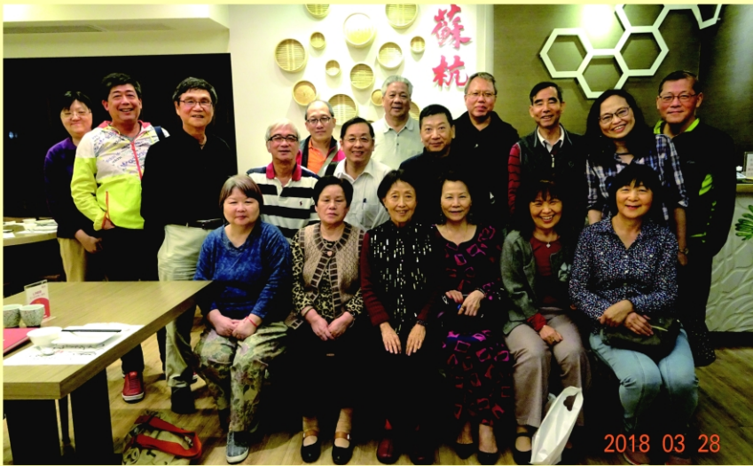
← 理事長與 理監事及 會務人員 合影。