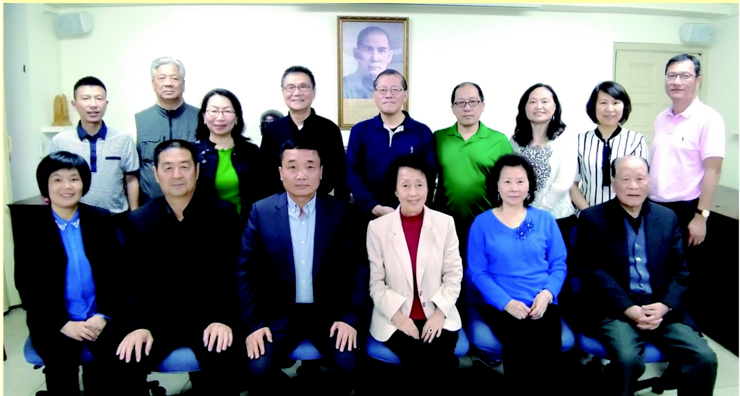
溫州市兩岸半屏山婦女兒童工作交流團蒞會參訪。