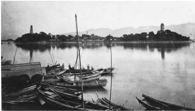
晚清江心嶼。(約攝於 1878~1880 年)

江心嶼位於市區北面甌江之中，是中國四大名嶼之一，有「詩之島，佛之嶼」的美稱。南宋前，江心寺原為兩座孤嶼，東島有建於咸通七年（866）的東院普寂禪院及東塔；西島有建於宋開寶二年（969）的西院淨信講院及西塔。東西對峙，中貫川流。宋建炎四年（1130），高宗南渡，嘗駐蹕東院，書「清輝」、「浴光」以榜二軒。特賜二院額，東曰「龍翔」，西曰「興慶」。南宋紹興七年（1137），青了禪師奉高宗旨意來住持江心兩寺，便率眾拋石填平，填基土上興建梵宇，高宗賜名「中川」，俗稱「江心寺」。至此，江心嶼才有了以「中川」為中心，「龍翔」「興慶」輔之這種主次分明，左右對稱的典型的中國傳統風格的佛教建築群。一改當時「中川雙分鹿苑而兩不成」的格局，達到了「分則氣散，合則神足」的江天佛國的鼎盛氣象。