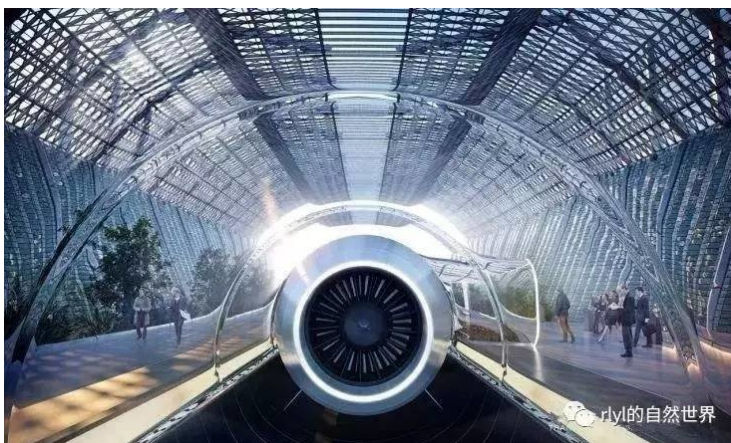
大陸工程專家拋出打造兩岸海底真空隧道的構想。 (圖擷自傳送門)

據大陸《科技日報》報導，4 月 22 日，中國科學院院士孫鈞，中國工程院院士顧國彪、樂嘉陵和許多專家齊聚舟山普陀，針對跨海旅遊真空飛行巴士進行技術研討，這也讓打造世界首條海底真空隧道呼之欲出。