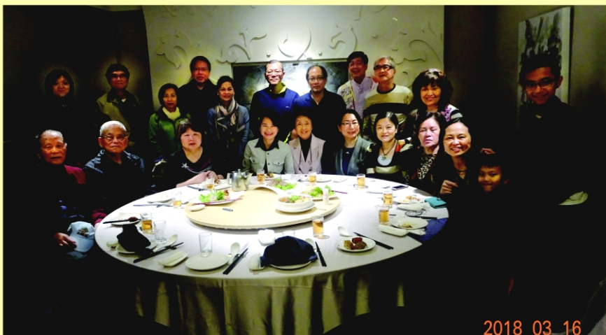
邢理事長愛菊宴請理監事與「六十週年慶祝大會籌備會」工作人員。