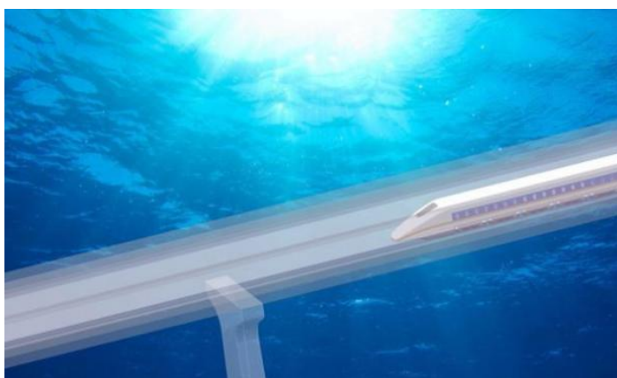
真空隧道想像圖。 大陸國家發改委、科技部等部門批准立案支持。

孫鈞表示，建設海底真空隧道主要是水下橋隧技術、磁懸浮列車技術以及真空技術的集成創新。大陸建造海底真空隧道列車在技術上基本沒有問題。