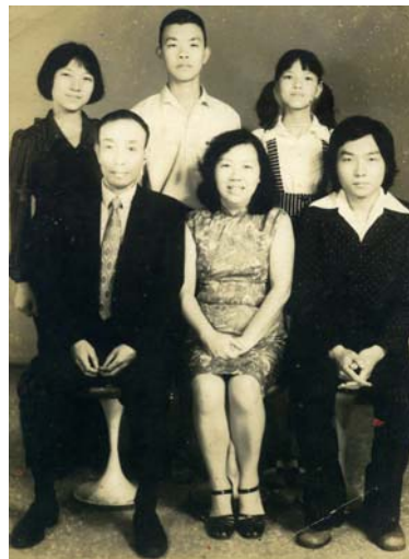
王微芳外公在臺灣的全家福▲►