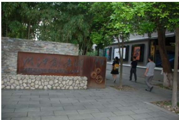
位於浙江工貿職業技術學院校區裡的浙江創意園，是溫州提供台青來創業就業的「十大園區」之一。

「我來溫州本來只是想當老師，但這裡的創業氣氛太盛，讓我現在也開始想當老闆了！」目前在溫州浙江工貿職業技術學院汽車與機械工