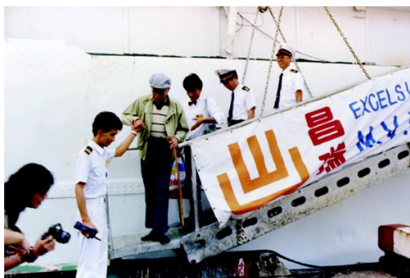
第一位乘坐探親船踏上上海土地的臺灣老兵。

要在那霸換船，既費時又費力，仍然十分麻煩。航運部門提出“以彎靠那霸同一船直航方式，解決下客換船弊端”的方案，卻又遭到了臺灣當局的否定。無奈之下，航運公司只好於當年十二月宣佈停航。此航線總共運行了十四個航次，運送臺胞一八八〇人次。雖然探親船隻維持了短短三個月，但是，在兩岸關係發展史上，卻是重彩濃墨的一頁。