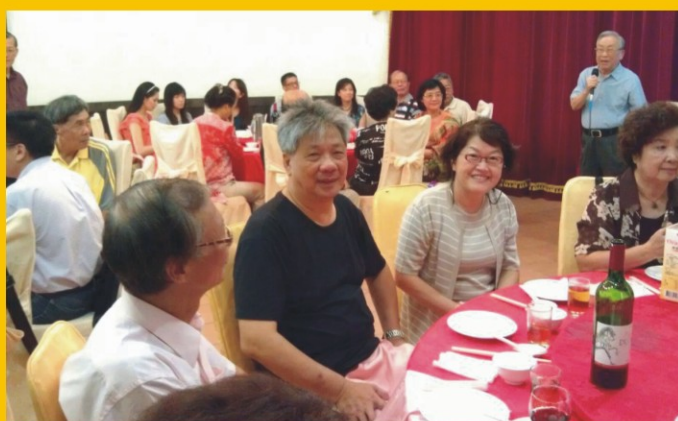
↑ ↗九月廿二日，江心會於台北三軍軍官俱樂部歡慶中秋佳節。（毛昌榮）