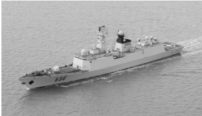
解放軍的軍艦徐州號。

第六，要建立釣魚島經濟開發集團，旅遊業、油氣開發、石油、文化等專案都由這個集團負責。我們要發行釣魚島主權基金，或者發行釣魚島主權彩票，讓全國人民關注釣魚島問題，激發全國人民的愛國熱情。