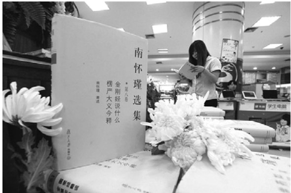
溫州書城裡，工作人員將南懷瑾先生所著的書籍擺放在顯眼位置並放上菊花以示緬懷之情。(劉偉)

此前，南老的門生籌措了巨資，用其名義在大陸創立光華獎學基金會，資助北大、浙大等三十多所著名大學。南老近年長住江蘇省，並在當地設立太湖大學堂傳道。南老的著述內容涵蓋了儒、佛、道及諸子百家，兼及醫卜天文、拳術劍道、詩詞曲賦，凡三十餘種，在台灣的一家書店打算近期重新編印發行南老二十餘年來的三十餘本著作，以資紀念。