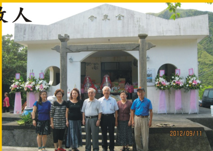
↑ ↗九月十一日本會陳繼樞理事長率理監事及會務人員至金瓜石，祭拜早年來台開拓的溫籍故人。（葉青青）