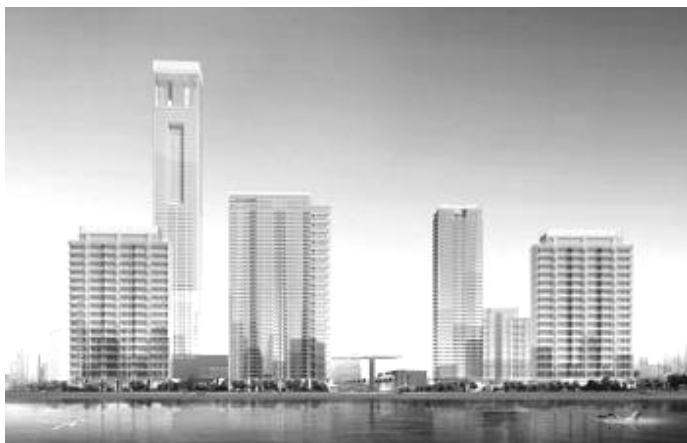
鹿城廣場的購物中心。

“低價跑量”幾乎是所有開發商在溫州市場今年的首選。當年的許多豪宅，價格都早已明顯下跌。曾經代表溫州樓市最高價的綠城鹿城廣場，二〇一〇年市場巔峰時的二手房價格一度接近十萬元／平方米，現在已腰斬，有些戶型成交價甚至還不到五萬元／平方米。