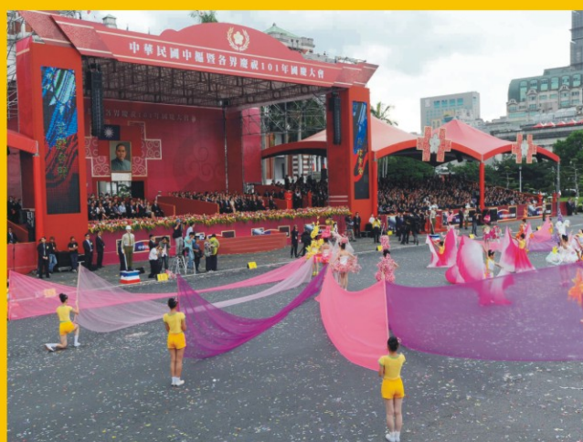
↑ ↗ 十月十日在總統府前的慶祝大會中，青春洋溢的女學生表演精彩的舞蹈、精神抖擻的儀隊演出。